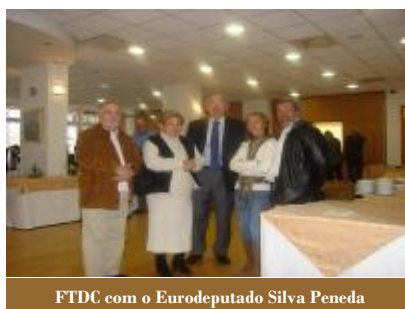
FTDC com o Eurodeputado Silva Peneda

Como conclusões subjacentes a este encontro retiraram-se da fundamentalidade para que a qualidade de trabalho atinja índices elevados, torna-se absolutamente necessário que o factor de formação seja cada vez mais adequado ao binómio existente entre as premissas teóricas e práticas, as quais só poderão ser alcançadas, num âmbito de globalização do